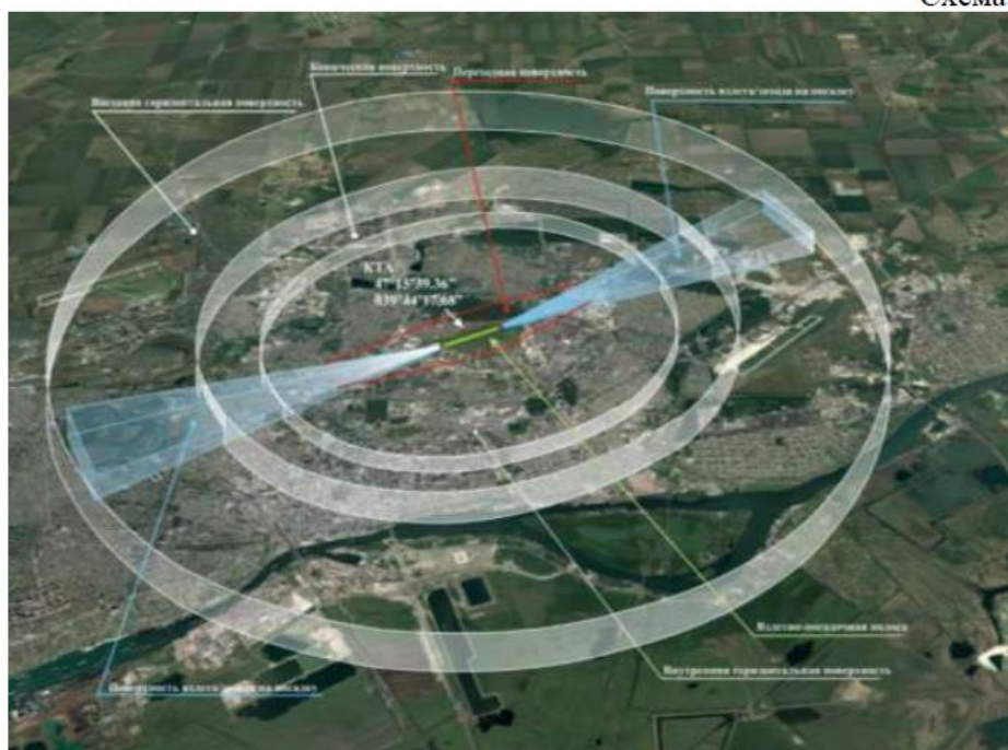
Таблица 4.1. и 4.2. НГЭА ЭА (Таблица №23)